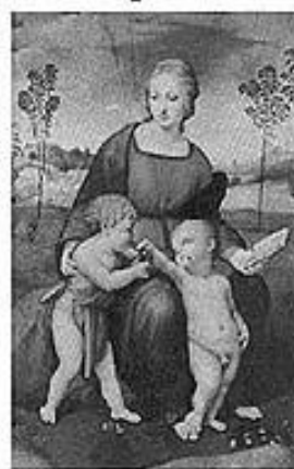
Obra de Rafael Sanzio